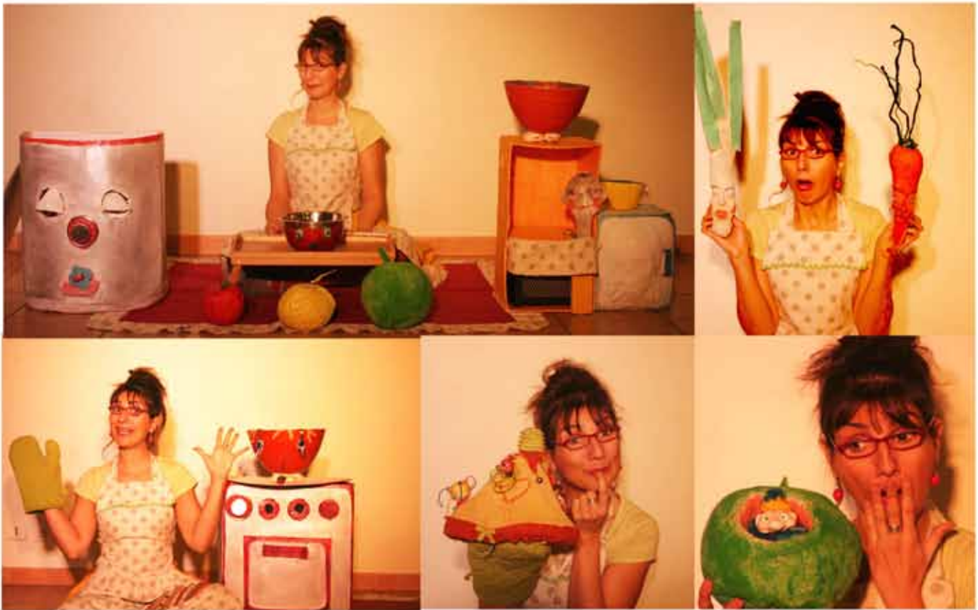
Miam !, Un nuage passe , marionnettes sonores en crèche.